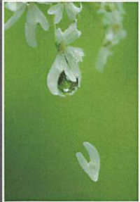
~心模様~ 揺れる気持ち