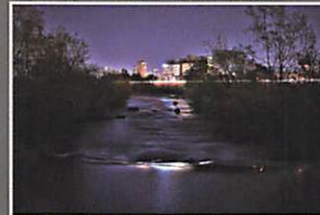
豊平川に流れ込む、山鼻川の夜景